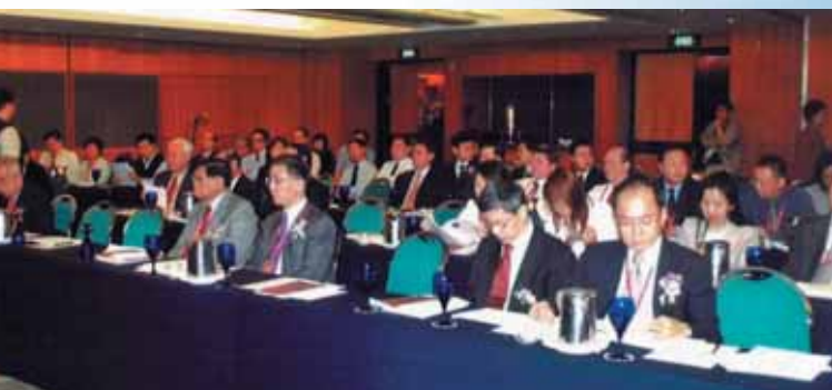
当天大约130人出席华资论坛

会议赞助机构包括金钟机械私人有限公司（$5000）、美亚集团（$3000）、世界科技出版公司（$3000）、新浦化学有限公司（$3000）。