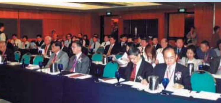
当天大约130人出席华资论坛

会议赞助机构包括金钟机械私人有限公司（$5000）、美亚集团（$3000）、世界科技出版公司（$3000）、新浦化学有限公司（$3000）。